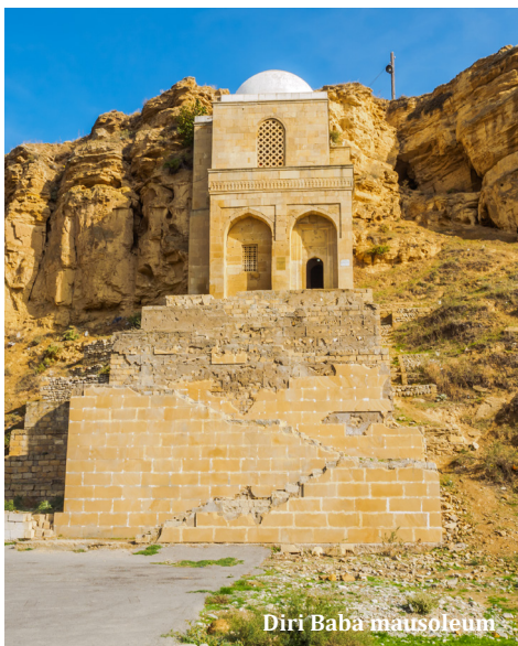
Diri Baba mausoleum

Vi fortsätter sedan till Sheki där vi slår läger för natten.